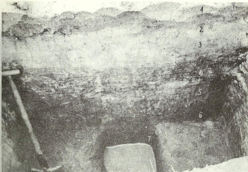
Fot. 10. Osady stokowe w dnie doliny wód roztopowych w okolicy Ostrowa. Objaśnienia w tekście