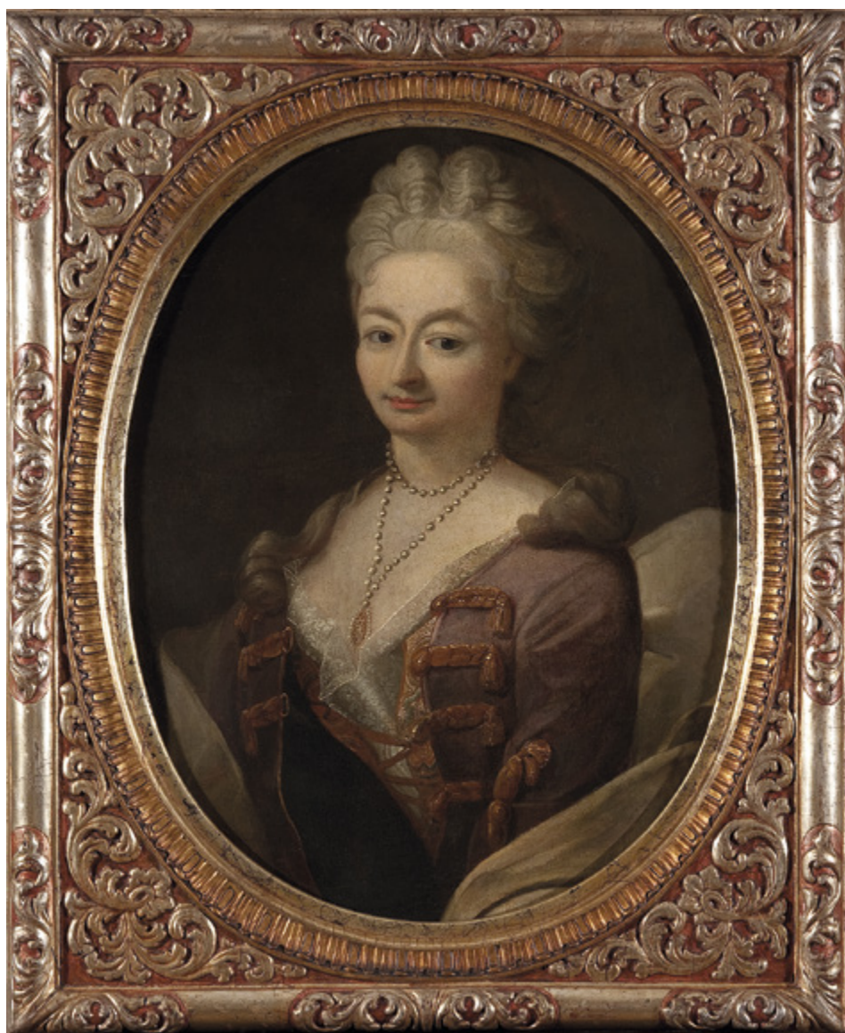
4. Katarzyna z Opalińskich Leszczyńska, królowa Polski, portret olejny z 1718 r. Muzeum Narodowe w Warszawie, nr inw. MP 3192 MNW