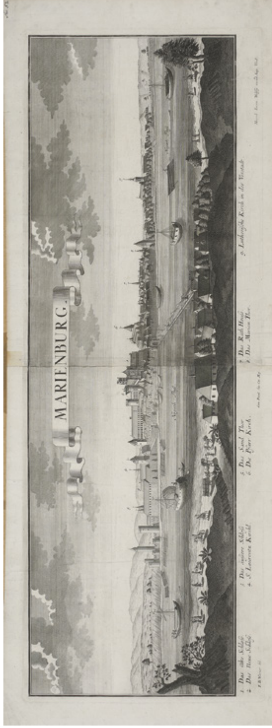
9. Panorama Malborka od strony Nogat, rys. Friedricha Bernharda Wernera (1690–1776) po 1727, miedzioryt wyd. między 1727–1754 przez spadkobierców Jeremiasa Wolffa w Augsburgu. Muzeum Zamkowe w Malborku, sygn. R/979