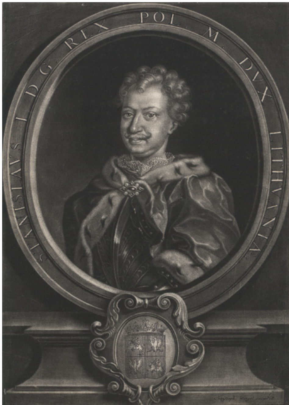
2. Stanisław Leszczyński, król Polski, po 1705?, mezzotinta wyd. przez Christopa Weigla w Norymberdze przed 1726. Biblioteka Narodowa w Warszawie, nr inw. G. 28193