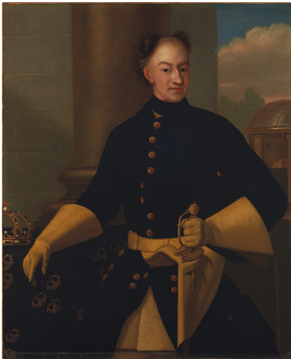
7. Karol XII, król Szwecji, portret według Davida von Kraffta. Zamek Królewski w Warszawie, nr inw. ZKW/1046