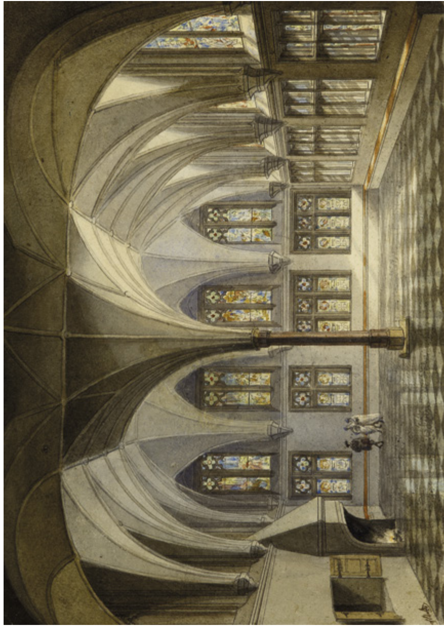
13. Wnętrze Letniego Refektarza w Pałacu Wielkich Mistrzów w 1834 r., akwarela J.K. Schultza z 1850 r. Muzeum Zamkowe w Malborku, sygn. DH/765, k. 12