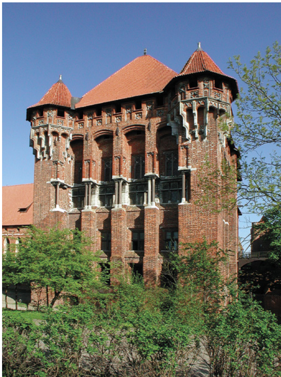
14. Obecny wygląd Pałacu Wielkich Mistrzów na Zamku w Malborku.