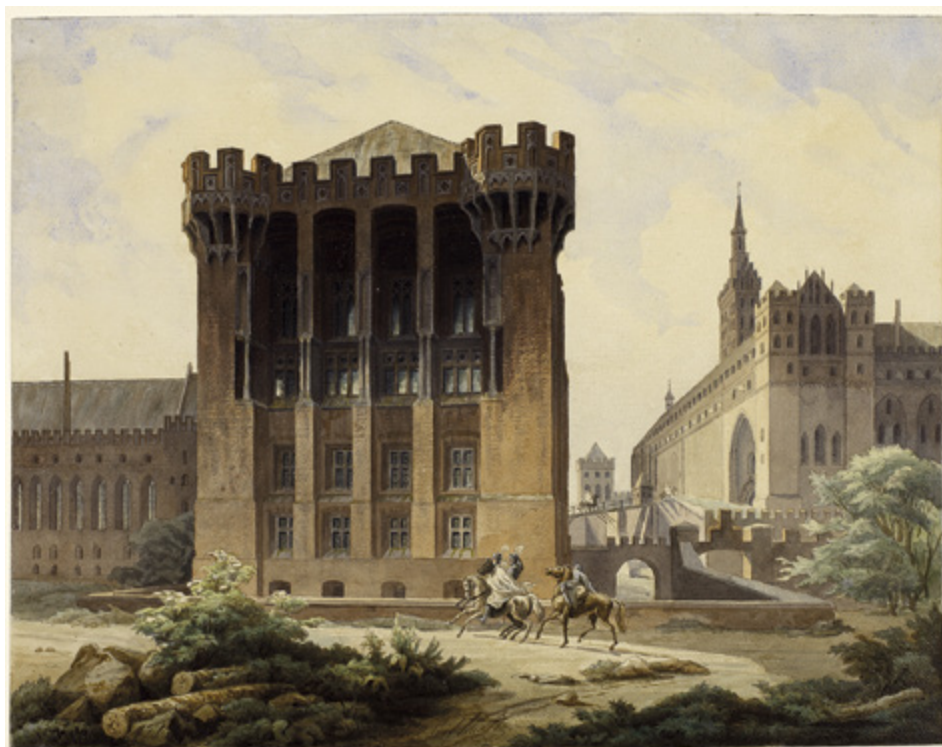
11. Pałac Wielkich Mistrzów od zachodu (od strony Nogatu), akwarela J.K. Schultza z 1850 r. Muzeum Zamkowe w Malborku, sygn. DH/765, k. 4