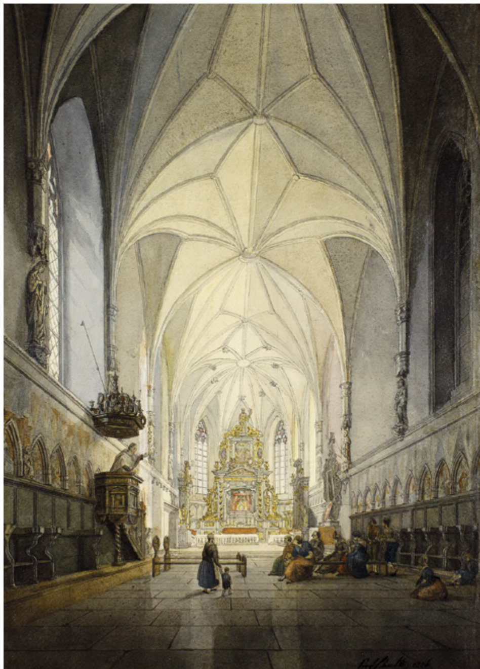
12. Wnętrze kościoła zamkowego NMP w Malborku, widok od wschodu na ołtarz główny, akwarela J.K. Schultza z 1846 r. Muzeum Zamkowe w Malborku, sygn. DH/765, k. 9