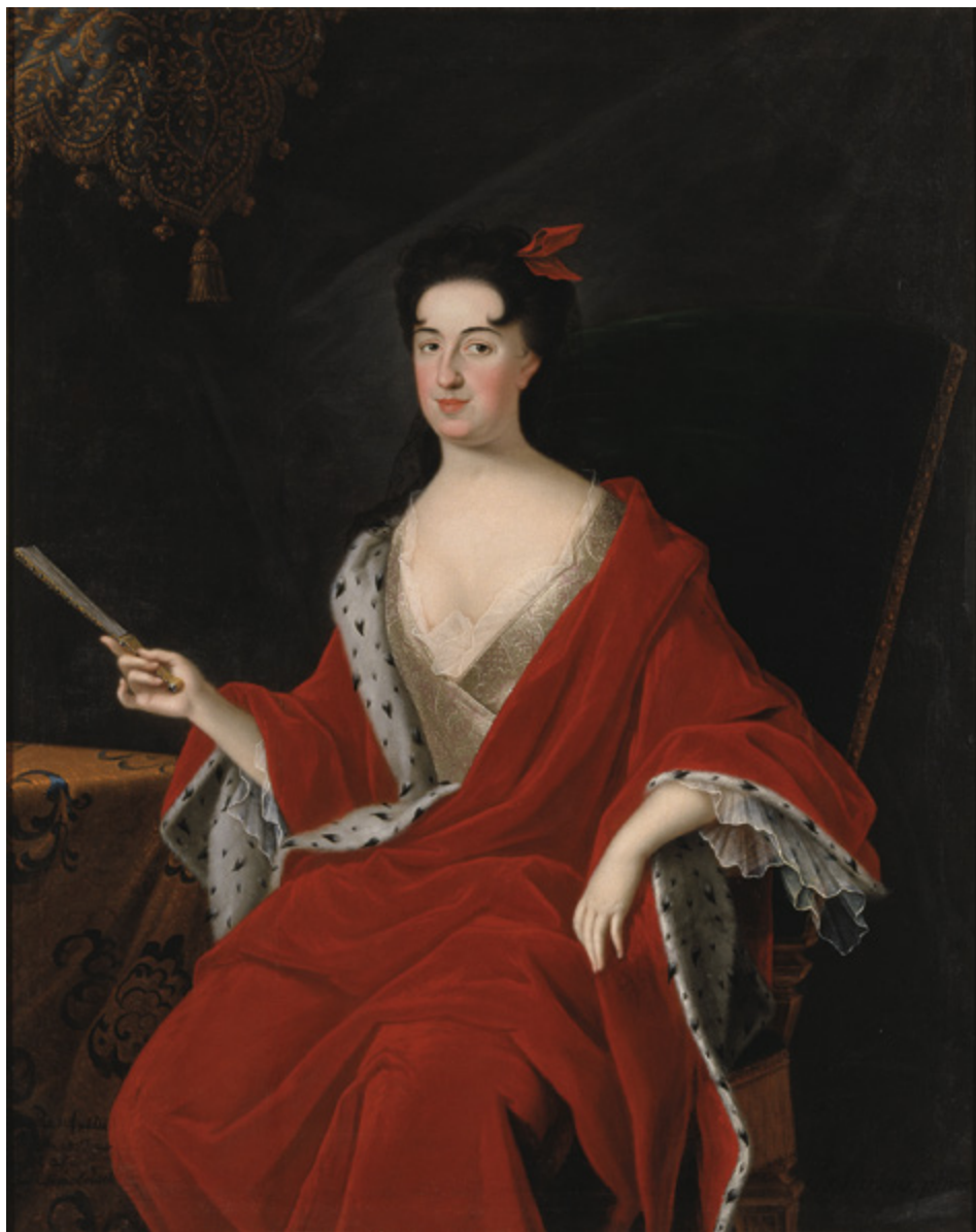
5. Anna z Jabłonowskich Leszczyńska, matka króla Stanisława, portret z ok. 1712 r. autorstwa Jana Starbusa. Nationalmuseum w Sztokholmie, nr inw. NMGrh 1186